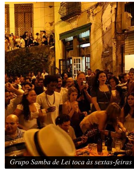
Grupo Samba de Lei toca às sextas-feiras