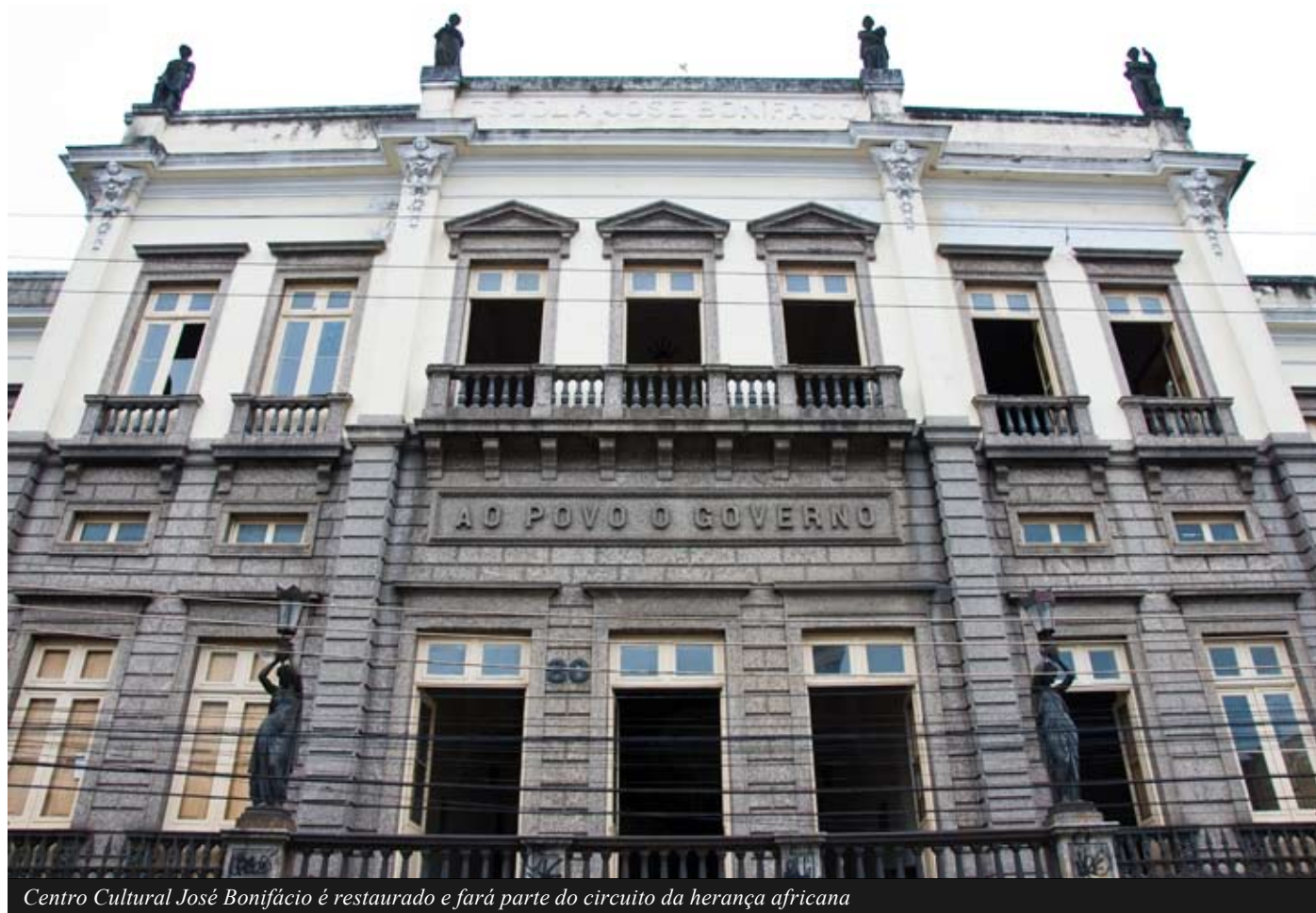
Centro Cultural José Bonifácio é restaurado e fará parte do circuito da herança africana

O palacete histórico da Gamboa, na Rua Pedro Ernesto, 80, foi inaugurado em 1877 por Dom Pedro II em homenagem ao patriarca da Independência