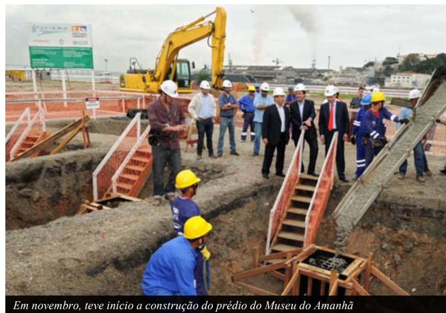
Em novembro, teve início a construção do prédio do Museu do Amanhã

O dia 1º de novembro de 2011 foi marcado pelo início das obras de construção do prédio do Museu do Amanhã. Com projeto de arquitetura concebido pelo renomado arquiteto espanhol Santiago Calatrava, o espaço será dedicado às Ciências, mas terá formato diferente dos museus de História Natural ou de Ciências e Tecnologia já conhecidos. O Museu do Amanhã será um ambiente