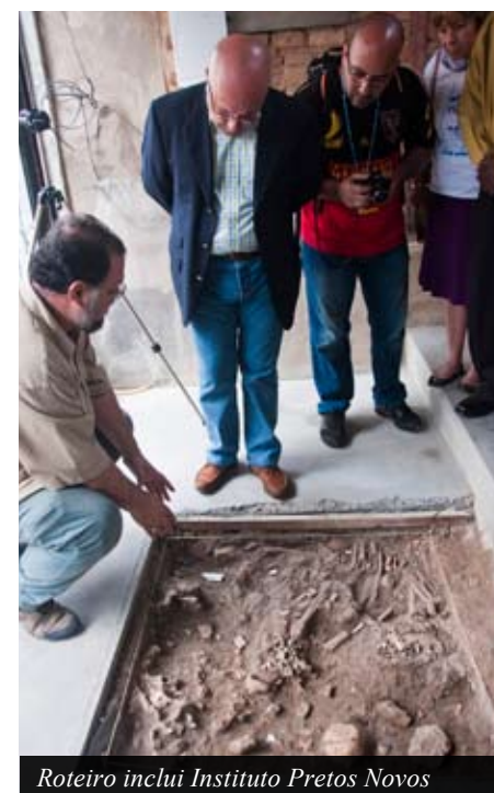
Roteiro inclui Instituto Pretos Novos

como o primeiro colégio público da América do Sul. Hoje, também conhecido como Centro de Memória e Documentação Brasileira, é sede do Centro de Referência da Cultura Afro-brasileira, único no gênero na América Latina. A restauração receberá investimento de R$ 3,205 milhões do Programa Porto Maravilha Cultural, que destina 3% dos recursos da venda dos Certificados de Potencial Adicional de Construção (Cepacs) à recuperação do patrimônio histórico, artístico e cultural da Região Portuária. O prédio restaurado será entregue no prazo de 300 dias.