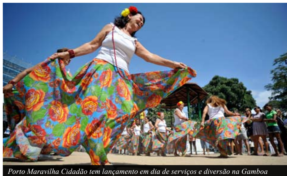
Porto Maravilha Cidadão tem lançamento em dia de serviços e diversão na Gamboa